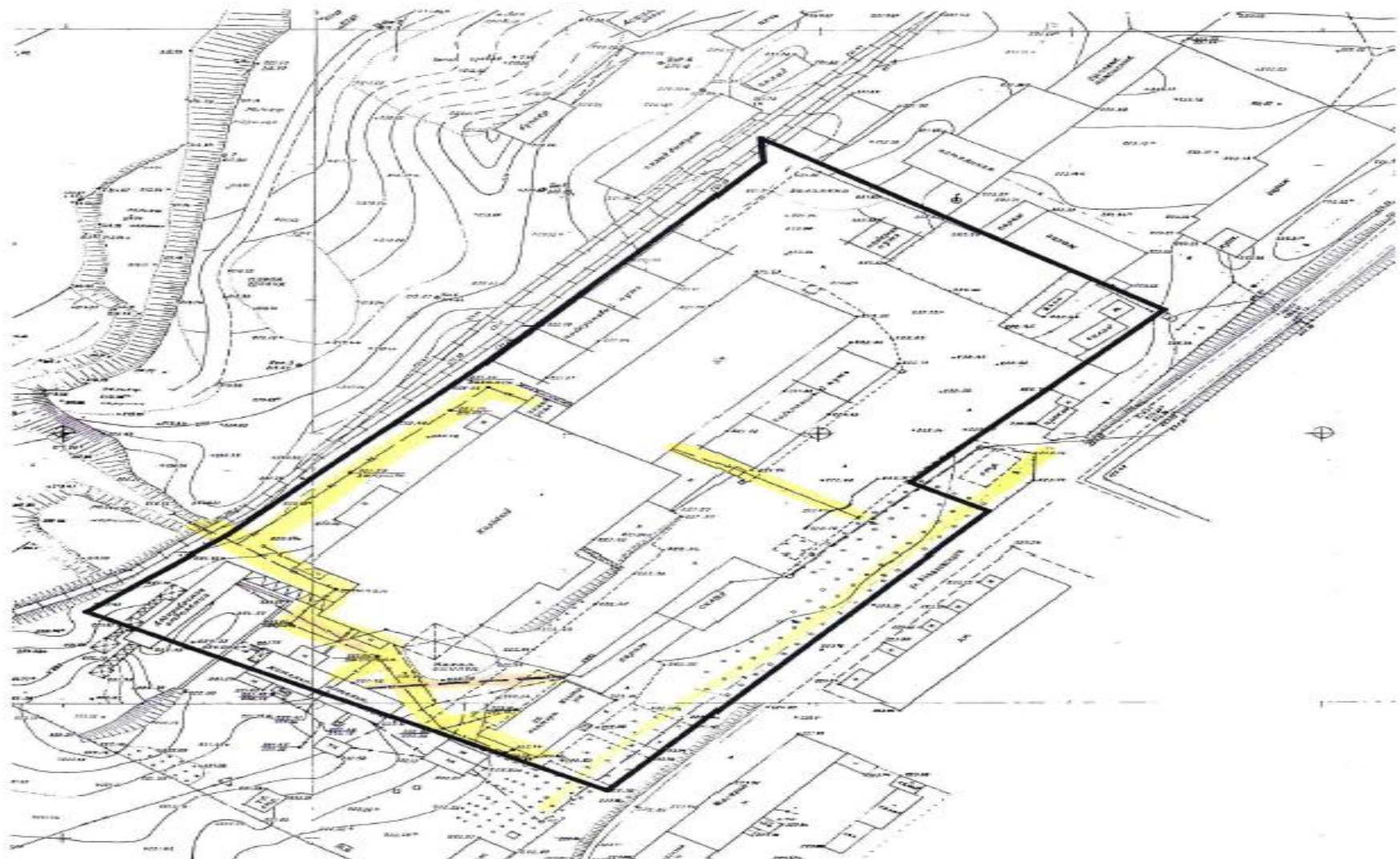
Анжеро-Судженск, Фрагмент [10691.891,11439.671] : [11007.635,11718.983]мм. Масштаб 1:1383